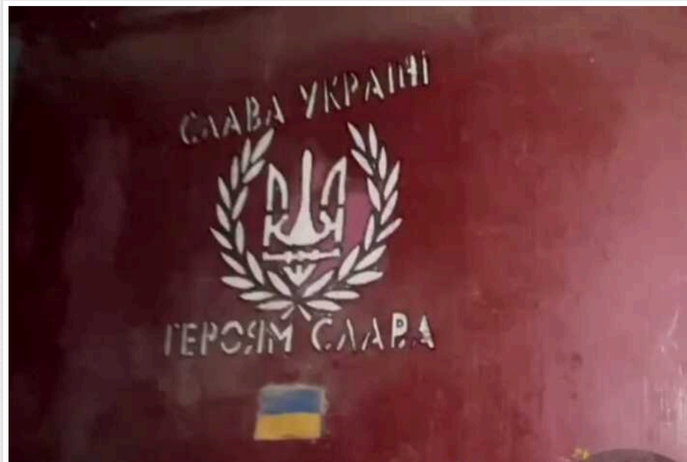
Україна розслідує розстріли окупантами полонених ЗСУ в Авдіївці та Веселому

СБУ за процесуального керівництва прокуратури розпочала розслідування за фактами розстрілів беззбройних українських військовополонених в Авдіївці та Веселому.