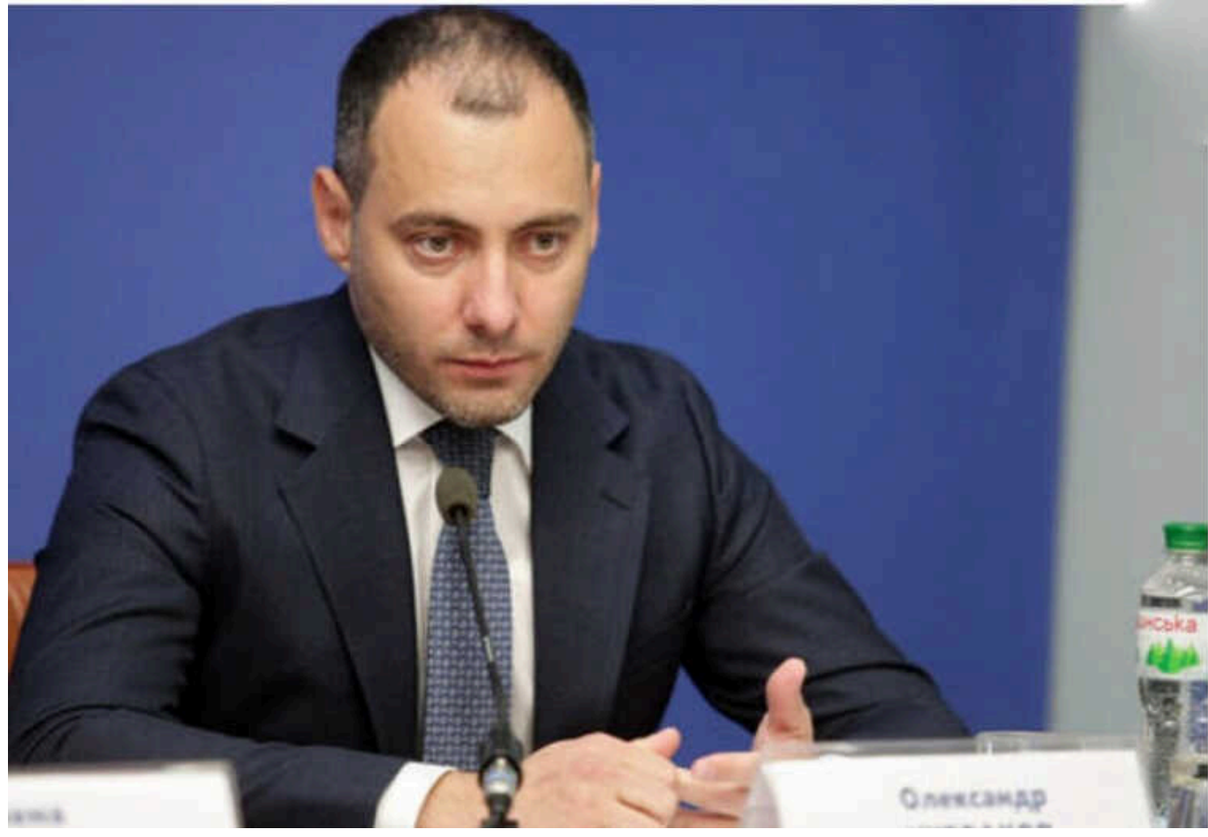
Окупанти намагаються обстрілами енергосистеми знеструмити ключові промислові регіони, - Кубраков

Цього року окупанти змінили мету атак на енергетичну систему України. Тепер вони намагаються залишити без електроенергії ключові промислові регіони.