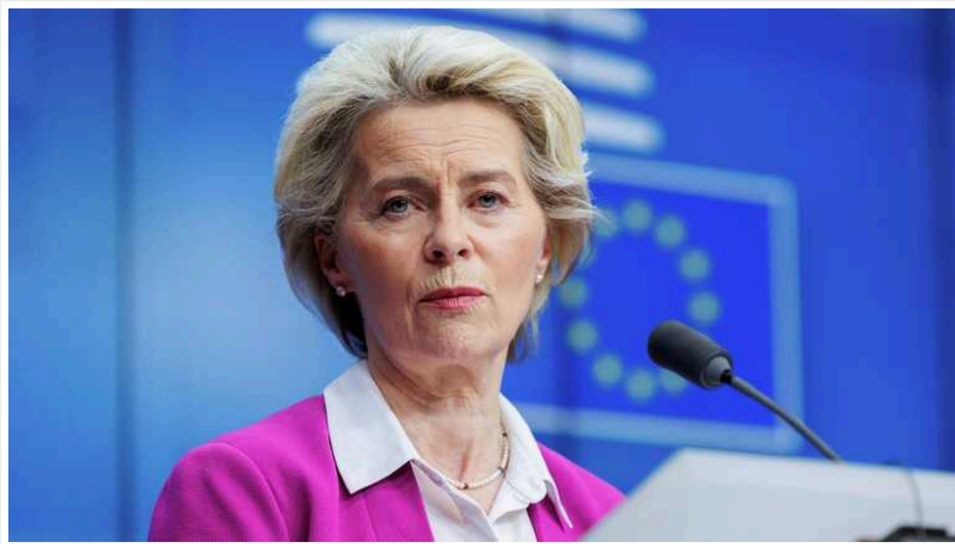
Фон дер Ляен хоче балотуватися на другий термін голови Єврокомісії – ЗМІ

Глава Єврокомісії Урсула фон дер Ляен незабаром оголосить про намір йти на другий термін.