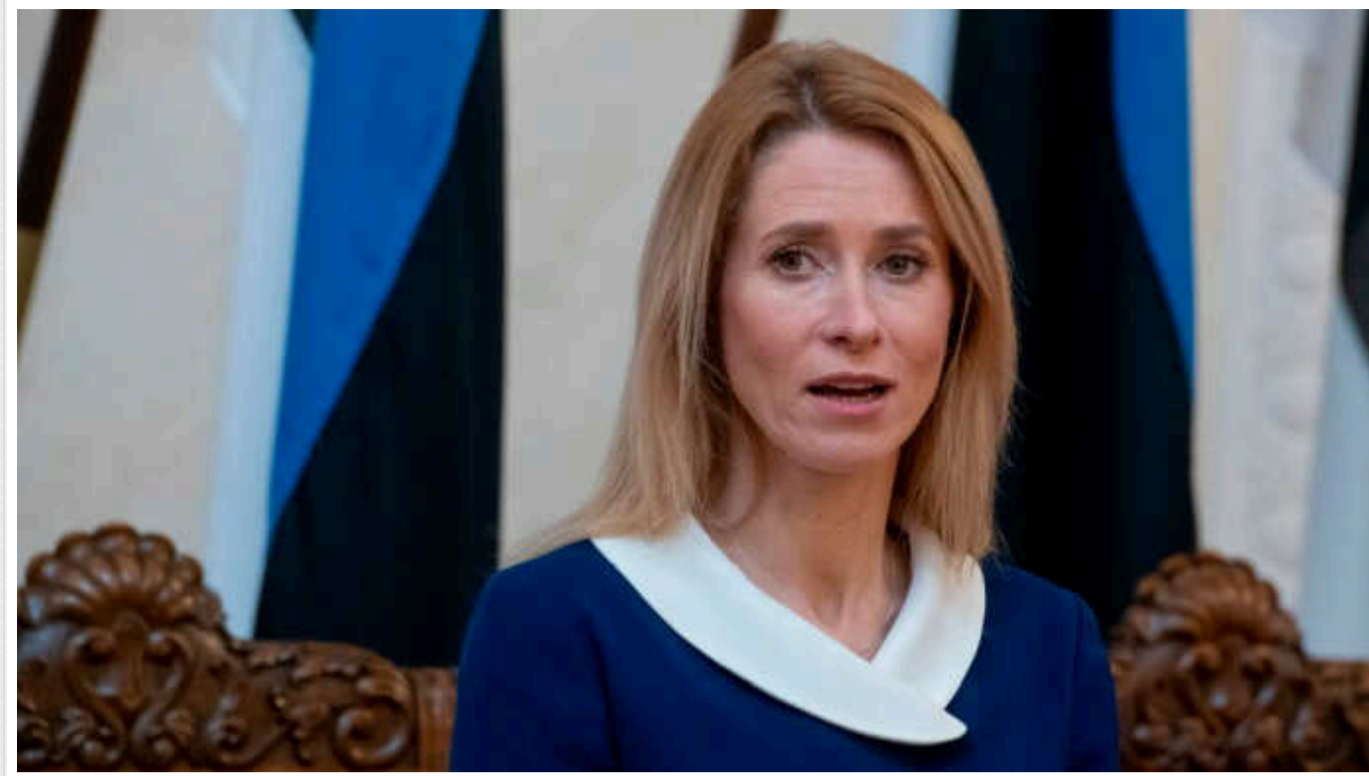
Каллас про потрапляння в розшук Росії: РФ мене не залякає

Прем'єрка Естонії Кая Каллас заявила, що оголошений Росією ордер на її арешт – це лише спроба залякати її на тлі припущень, що вона може отримати високу посаду в Євросоюзі.