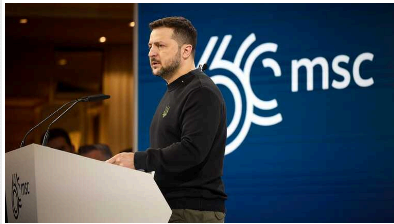
Зеленський на Мюнхенській конференції: Якщо наші командири "наступають" тільки по трупах солдатів, це безглуздо

Україна може не витримати тиску росіян на фронті, незважаючи на мотивацію. Дефіцит боєприпасів наваряд чи може бути усунений цього року.