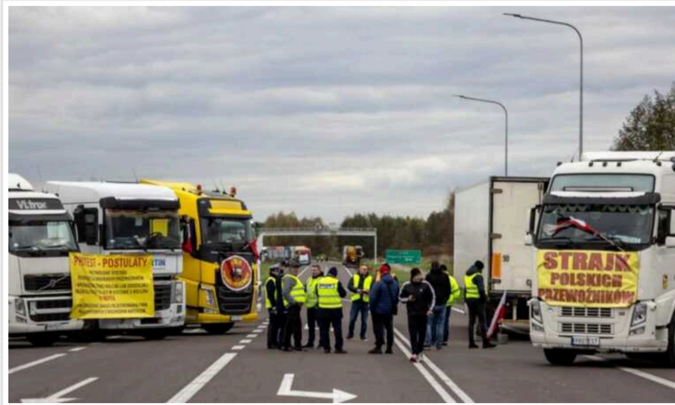
Повна блокада українсько-польського кордону загрожує Україні серйозними збитками

Якщо кордон не буде деблокований до кінця місяця бюджет країни втратить 7,7 мільярда гривень надходжень. Відповідно митниця план на цю суму недовиконає.