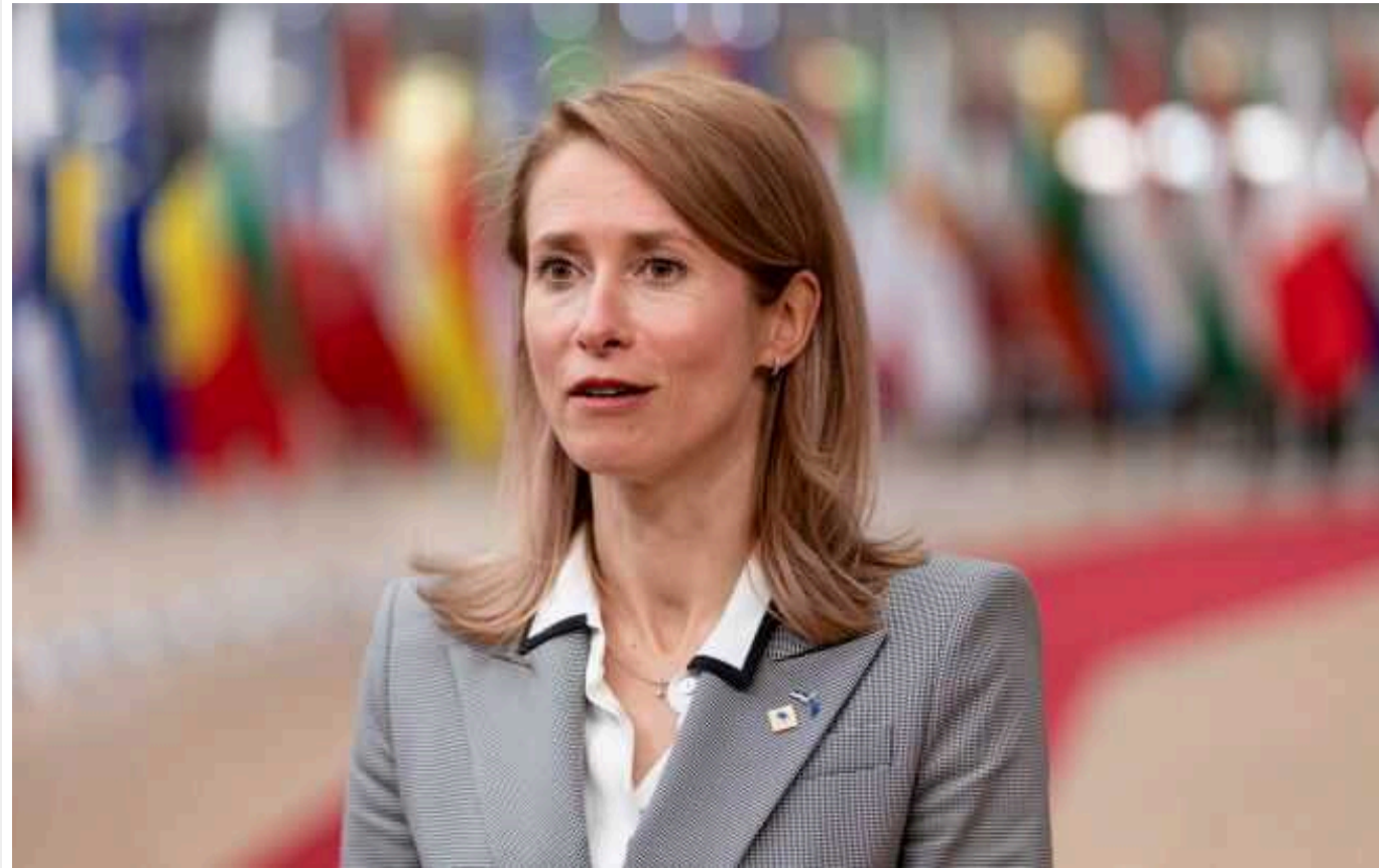
Прем'єрка Естонії Каллас запропонувала ЄС план для підняття "оборонки"

Прем'єрка Естонії Кая Каллас запропонувала Євросоюзу випустити єврооблігації на 100 млн євро, щоб профінансувати європейську оборонну промисловість. Також вона закликала робити більше для надання зброї Україні.