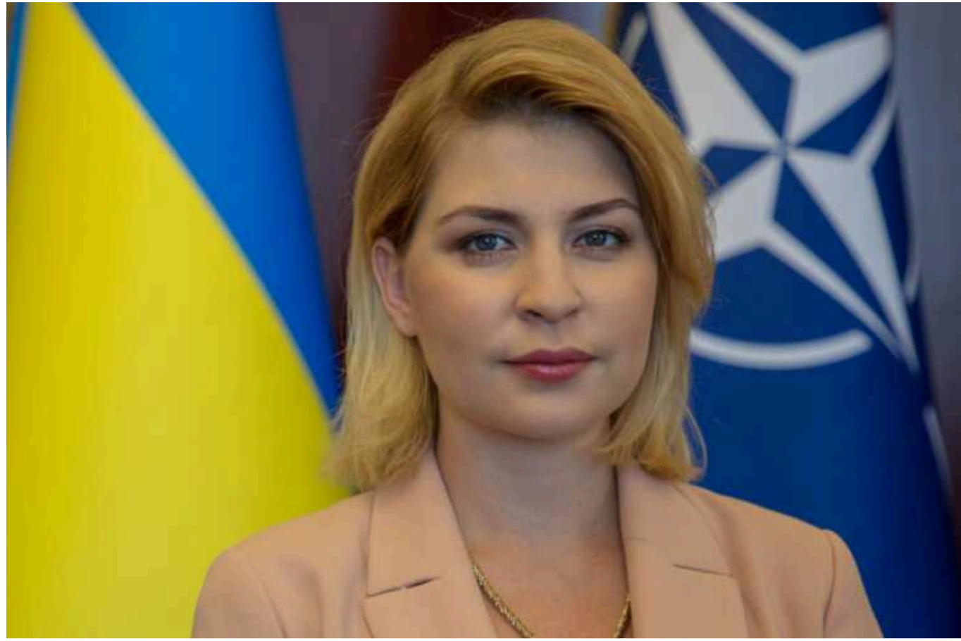
Україна та Сполучені Штати можуть підписати безпекову угоду і до саміту НАТО, – Стефанішина

Україна і США можуть підписати безпекову угоду і до ювілейного саміту НАТО у Вашингтоні в липні, однак українська сторона фокусується на голосуванні Конгресом за пакет допомоги, оскільки це – питання виживання.