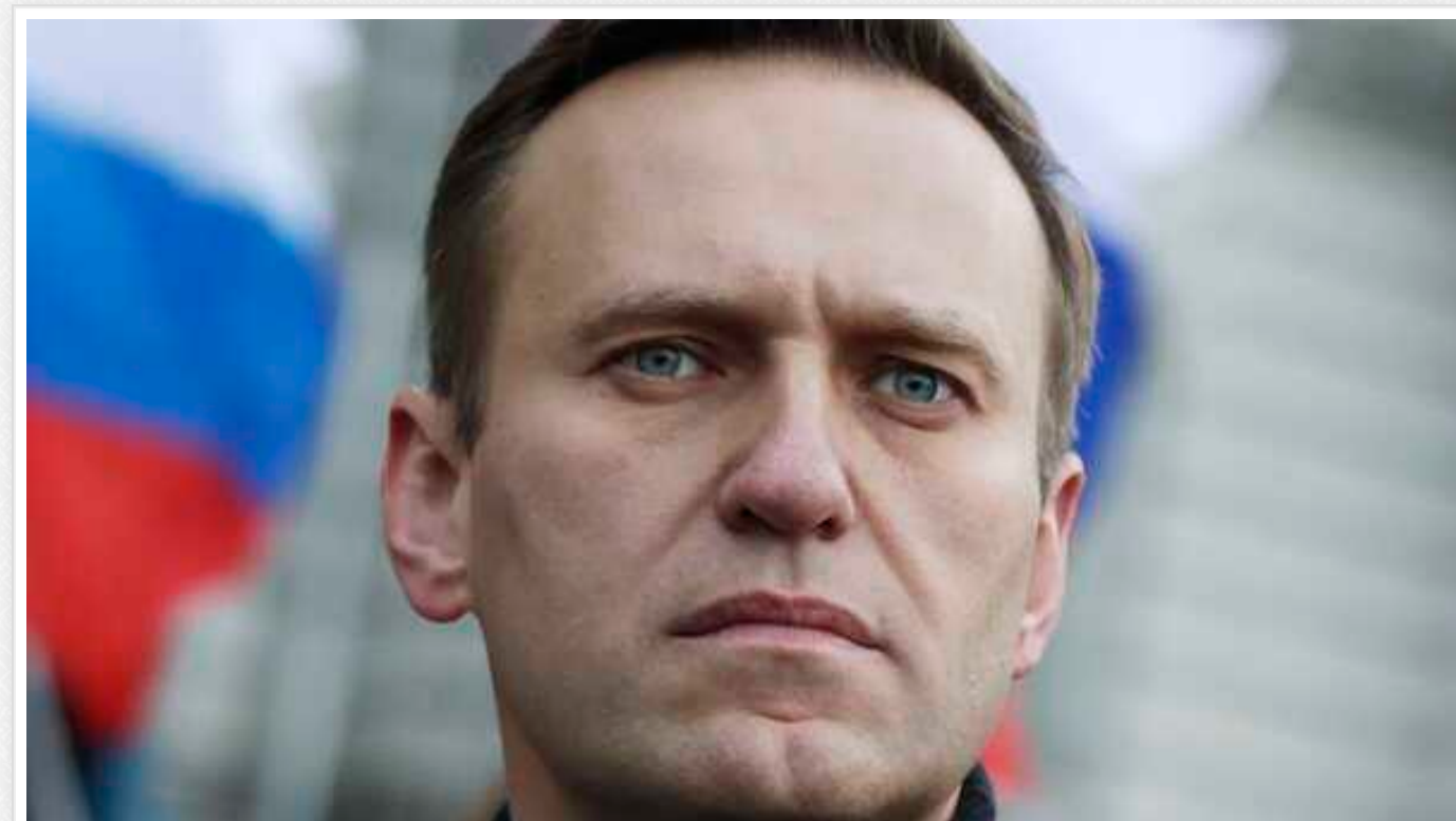
Bild: Незадовго до смерті Навального обговорювався його обмін

У російського опозиціонера Олексія Навального, який загинув у виправній колонії 16 лютого, нібито був шанс стати учасником обміну між РФ і ФРН. Його могли обміняти на Вадима Красікова – кремлівського агента, засудженого в Німеччині до довічного ув'язнення за вбивство колишнього чеченського польового командира Зелімана Хангошвілі.