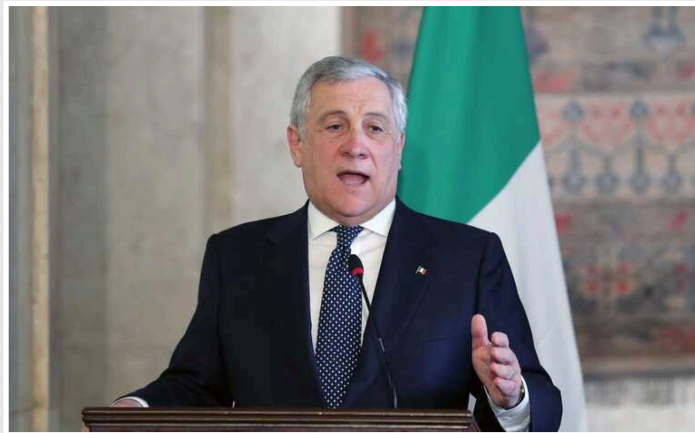
Україна має бути в НАТО, але після завершення війни, – глава МЗС Італії

Міністр закордонних справ Італії Антоніо Таяні сказав, що Україна у майбутньому має стати членом НАТО, але до завершення війни це, на його думку, надто ризиково і тому – неможливо.