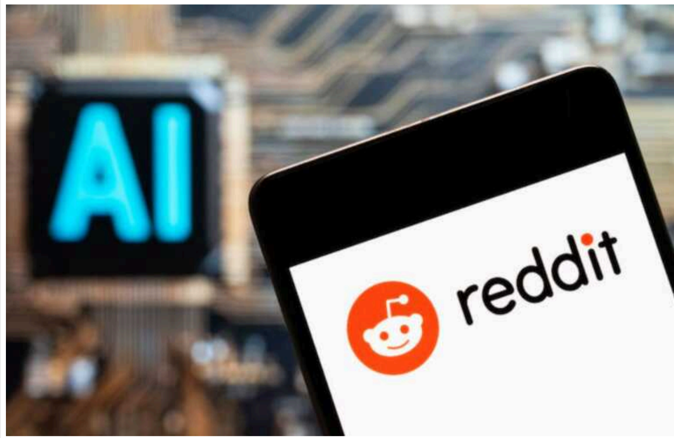
Bloomberg: ШІ навчатимуть на контенті Reddit

Соціальна мережа Reddit уклала угоду з неназваною ШІ-компанією на 60 млн дол., що дозволяє компанії тренувати свої моделі штучного інтелекту на контенті соцмережі.