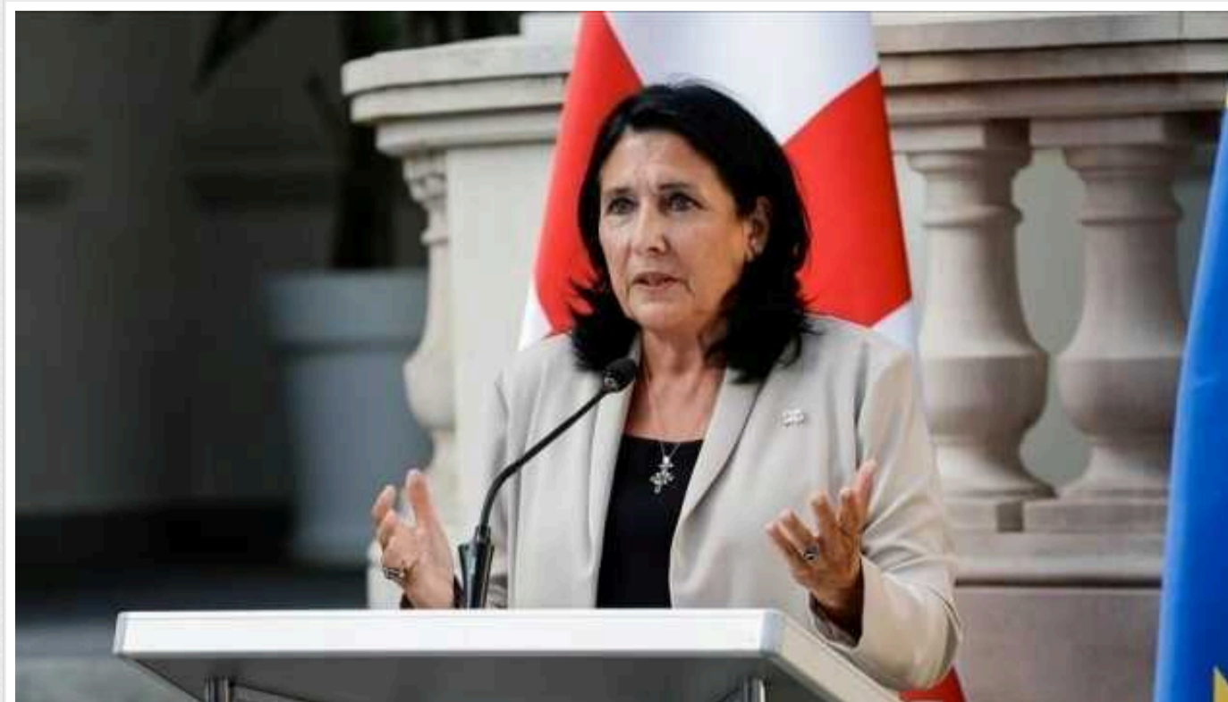
Треба не допустити того, щоб РФ стала винятковою силою в Чорному морі, – президентка Грузії Зурабішвілі

Президентка Грузії Саломе Зурабішвілі наголосила на необхідності не допустити того, щоб Росія стала винятковою силою в Чорному морі, чого вона намагається досягти.