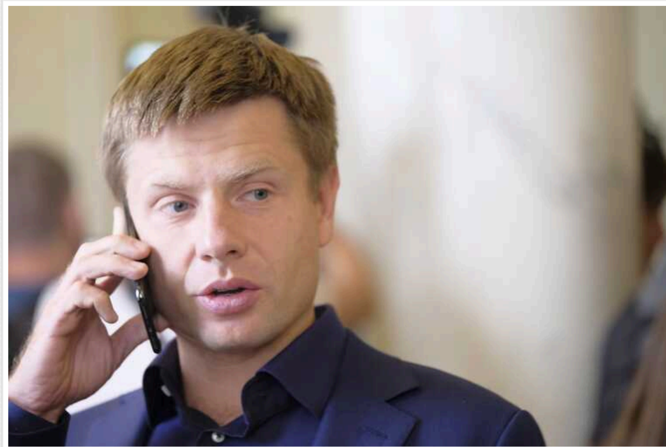
Гончаренко запитав Блінкена про перспективу вступу України до НАТО

Нардеп Олексій Гончаренко на Мюнхенській конференції з безпеки поставив держсекретареві США Блінкена питання – чи варто Україні розраховувати на вступ до НАТО, чи, якщо вступу не буде, починати роботу над створенням власної ядерної зброї.