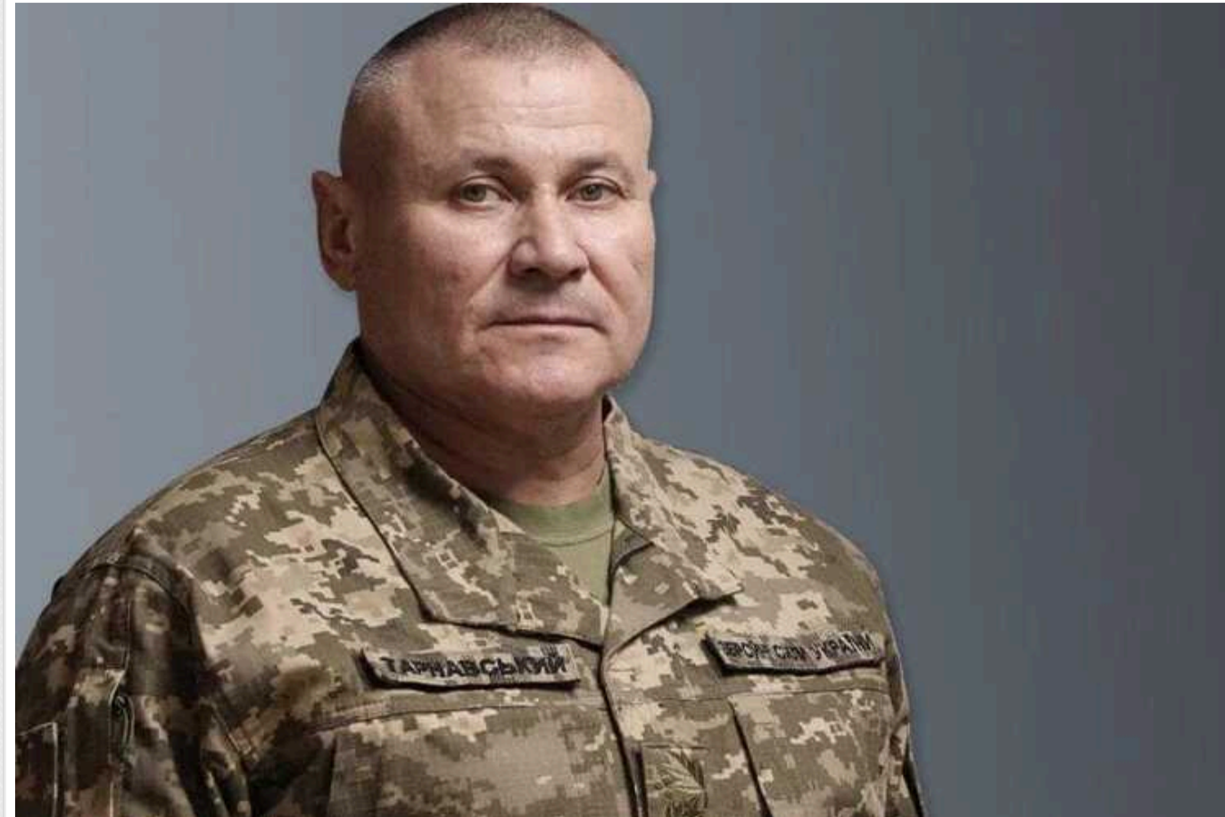
Тарнавський: За 4 місяці РФ втратила на Авдіївському напрямку понад 47 тисяч військових

Лише за 4 місяці активної фази Авдіївської оборонної операції втрати ворога становили понад 47 тисяч військових. Також наші воїни знищили сотні танків.