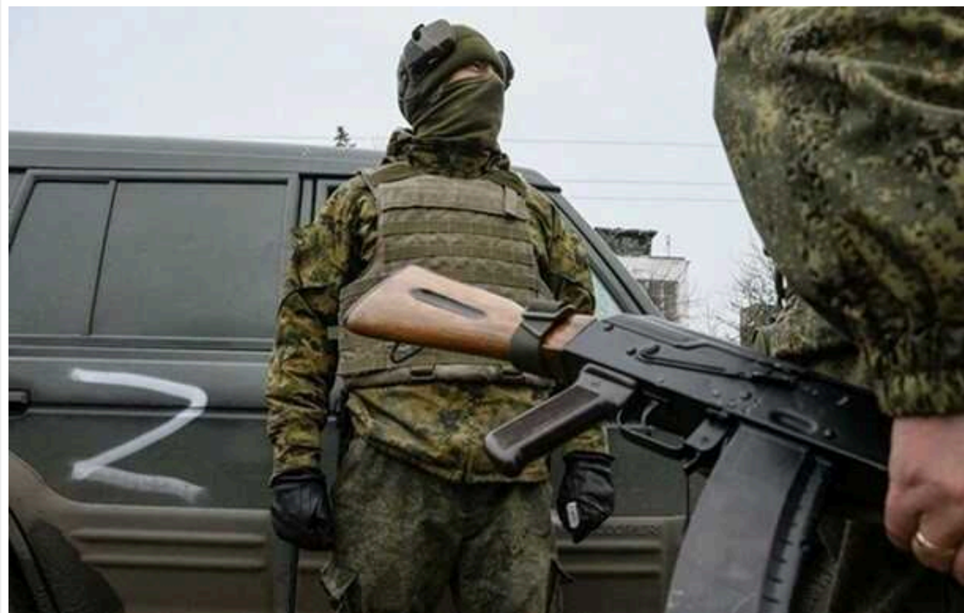
На окупованій Луганщині завершують підготовку до масової примусової мобілізації

На тимчасово окупованій частині Луганщини окупанти готуються до початку масованої примусової мобілізації. Списки чоловіків, яких загарбники планують пустити на "гарматне м'ясо", вже складено.