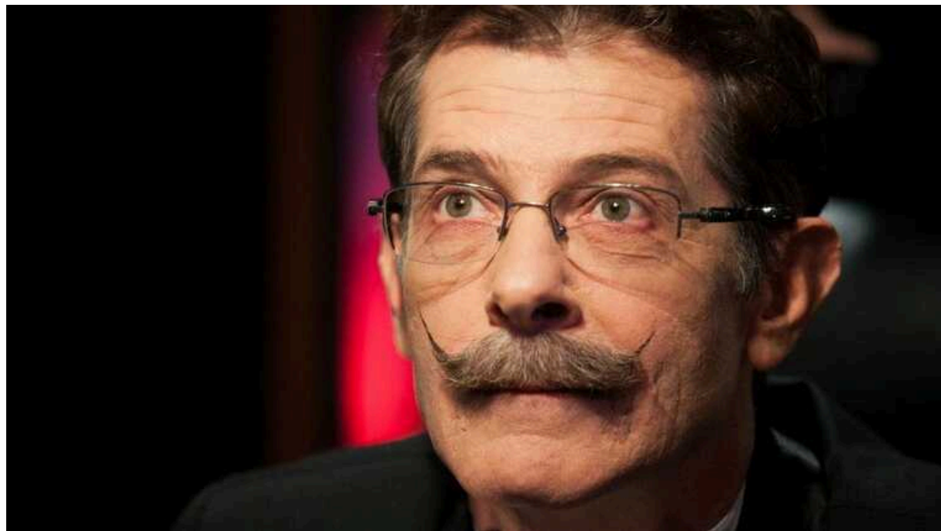
Зірка «Маски-шоу» Борис Барський розізлив українців поясненням, чому досі розмовляє російською: «Не можна історію Одеси викреслити»

Відомий українській комедійний актор та режисер, зірка гумористичної програми "Маски-шоу" Борис Барський продовжує розмовляти російською мовою, використовуючи її не лише в побуті, а й у публічній сфері, зокрема, на інтерв'ю.