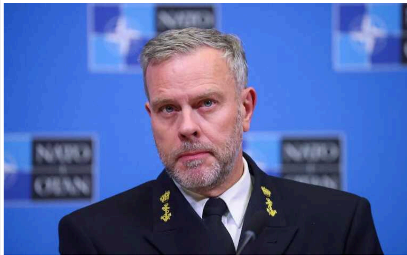
Адмірал НАТО Роб Бауер про Авдіївку: невелика втрата, песимісти не виграють у війнах

З військового погляду Авдіївка – невелика втрата, оскільки ворог зруйнував усю інфраструктуру міста.