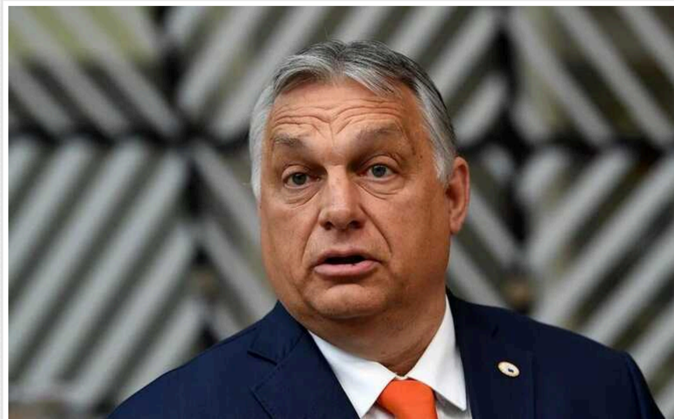
Орбан сказав, коли Угорщина ратифікує вступ Швеції до НАТО: «Суперечка скоро буде вирішена»

Парламент Угорщини незабаром буде готовий ратифікувати членство Швеції у НАТО. Це має статися, коли угорські депутати зберуться на весняну сесію, яка розпочнеться наприкінці цього місяця.