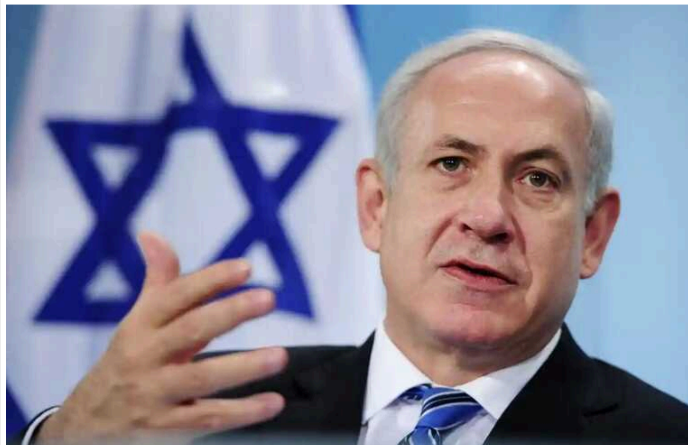
Нетаньягу: Ізраїль вестиме війну до абсолютної перемоги над ХАМАСом, включно з бойовими діями в Рафаху

Прем'єр-міністр Ізраїлю Беньямін Нетаньягу прокоментував очікувану ізраїльську операцію в Рафаху. Він також розповів про те, чи були плани у ЦАХАЛ увійти в місто на півдні Гази на початку наземного наступу, і якщо так, то чому цього кроку не було зроблено тоді.