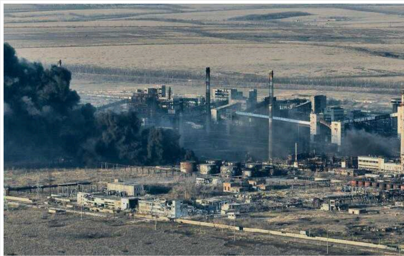
В ISW вказали, що допомогло прориву військ РФ в Авдіївці: закидали квартали міста десятками КАБів

В останні дні наступальної операції із захоплення Авдіївки війська Росії тимчасово встановили обмежену та локалізовану перевагу в повітрі. Вони просто закидали квартали міста, де могли перебувати українські позиції, десятками керованих авіаційних бомб (КАБ) на добу.