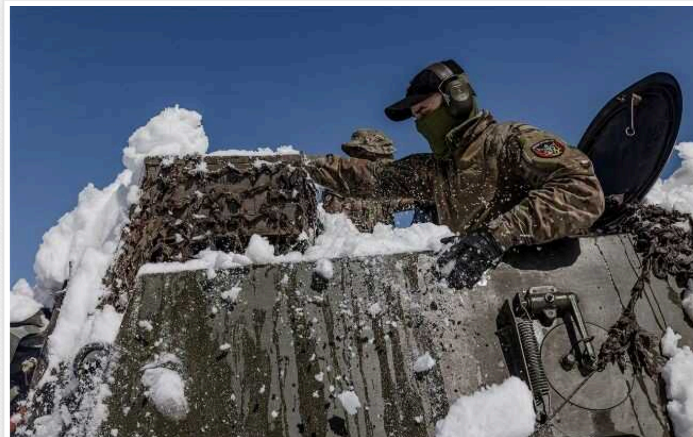
Ситуація на фронті: на Авдіївському напрямку українські захисники за добу відбили 14 атак окупантів

Захисники України протягом минулої доби зіткнулися з окупаційними військами РФ у 82 бойових зіткненнях на всій лінії фронту. Воїни відбили 14 атак на околицях Авдіївки, яку ворог захопив напередодні.