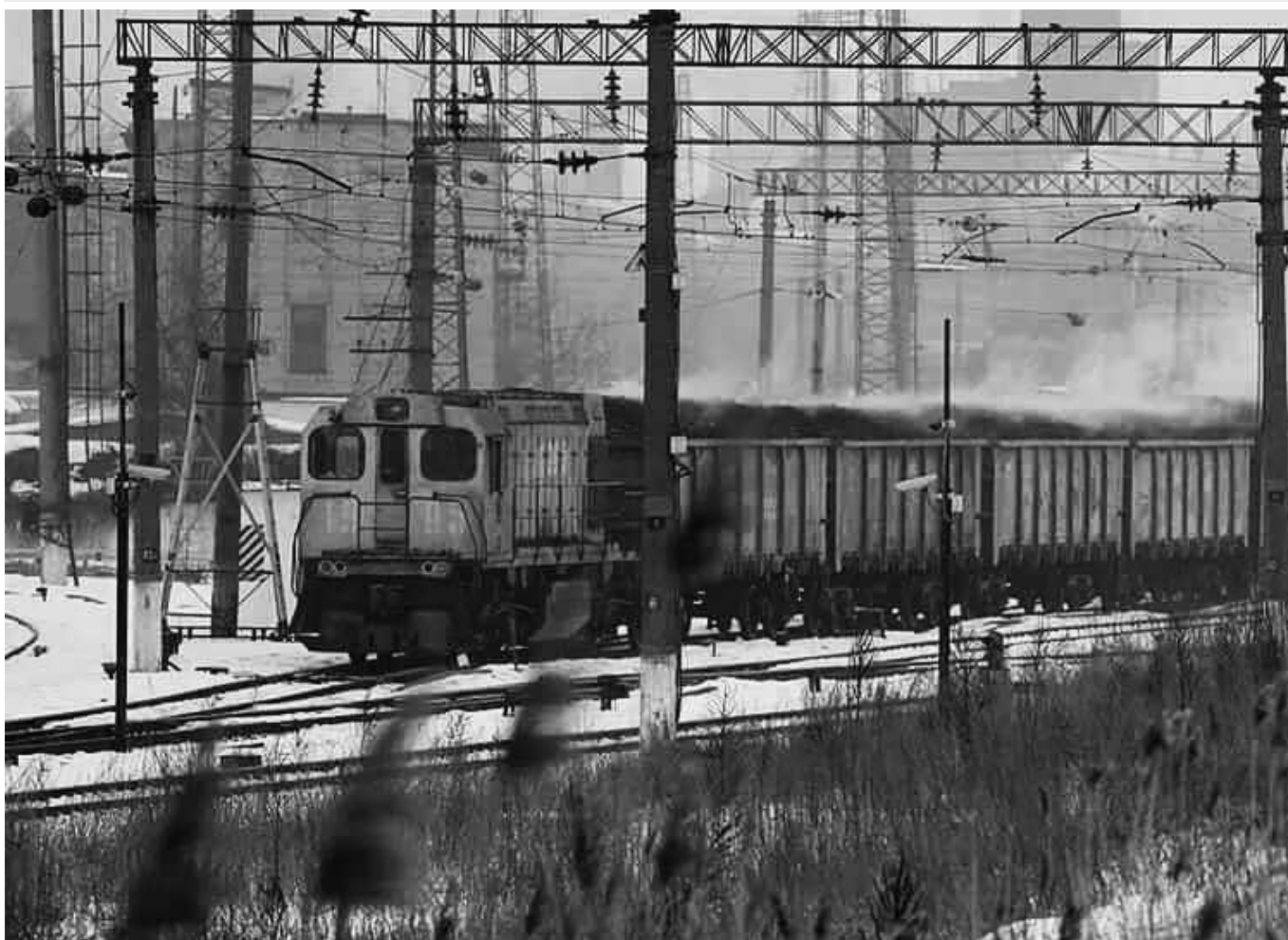
Фотограф показав захоплене армією РФ місто сім років тому: «Такою я бачив Авдіївку у 2017-му»

Український фотограф і фотожурналіст Ян Доброносів показав фото Авдіївки, зроблені в 2017 році. Тоді за прифронтове місто теж точилися бої, але російському агресору не вдалося його взяти.