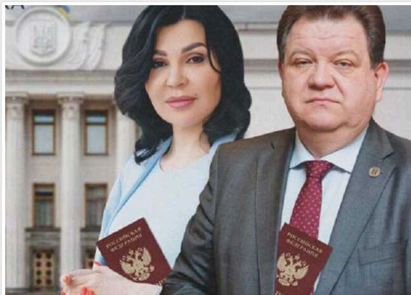
Російське громадянство в українських чиновників і судді: чому держава програє в судах?