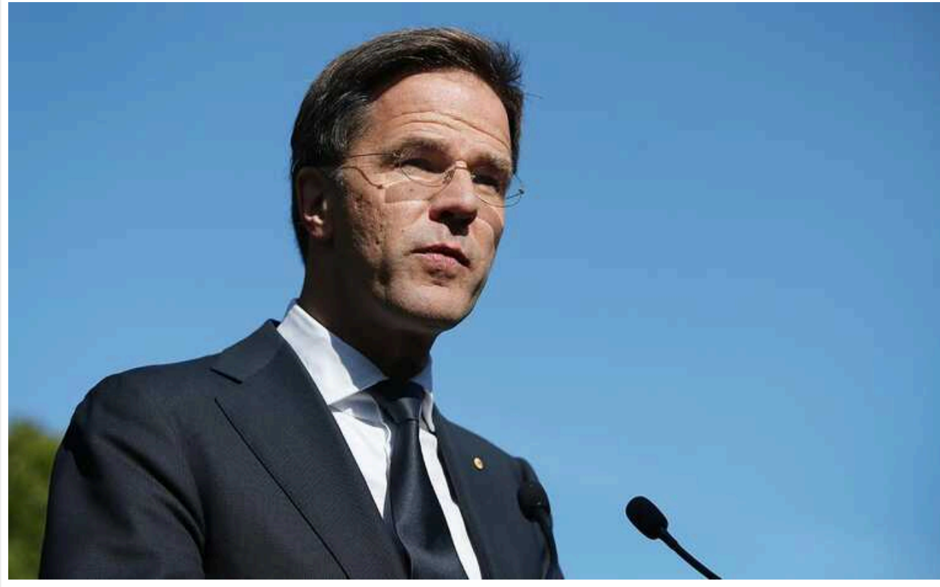
Прем'єр Нідерландів Рютте: "Поки Україна бере участь у бойових діях, вона не може бути прийнята до НАТО"

Прем'єр-міністр Нідерландів Марк Рютте на Мюнхенській конференції з безпеки заявив, що поки Київ веде війну, вступ України до Північноатлантичного Альянсу неможливий.