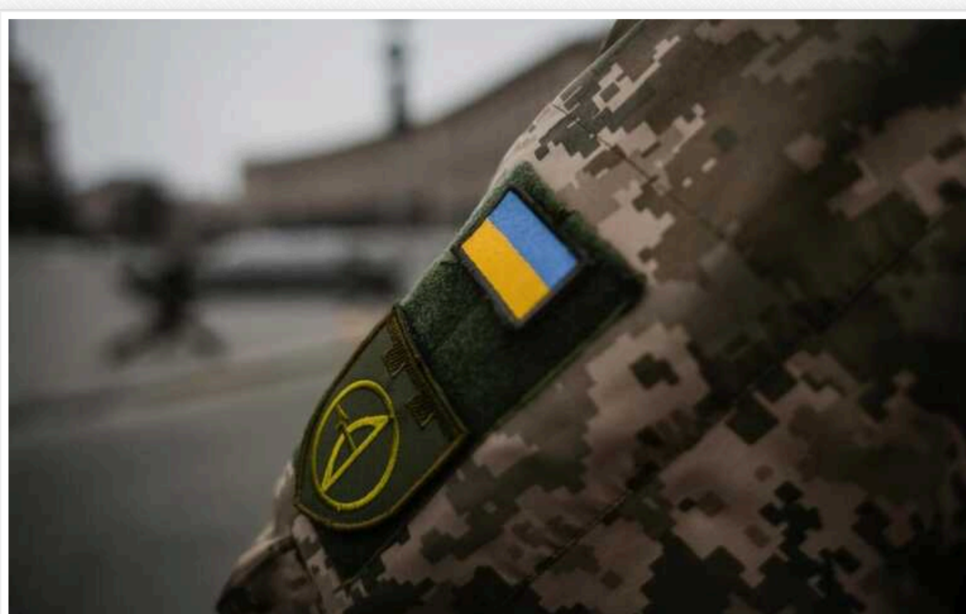
У Львівській області на ВЛК чоловік порізав собі вени

Чоловік був знятий з військового обліку, проте в ТЦК у нього відібрали військовий квиток, видали новий і визнали придатним до служби.