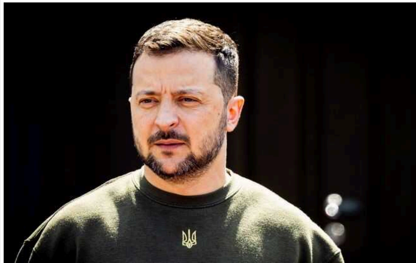
Bloomberg: Україна хоче провести саміт за формулою Зеленського та прагне зустрічі з Китаєм

Союзники України прагнуть, щоб будь-які збори високого рівня включали різних учасників із нових держав, зокрема Бразилії, Південної Африки та Індії. Участь Китаю вважається особливо важливою з огляду на вплив, який Пекін має на Росію.