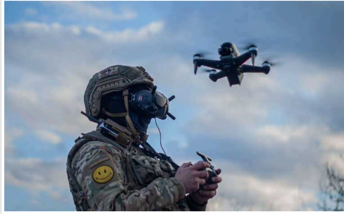
Bloomberg: Західні союзники планують озброїти Україну новітніми дронами зі штучним інтелектом

Країни Заходу, зокрема Велика Британія та США, планують надати Україні тисячі новітніх безпілотників зі штучним інтелектом Swarm Drones. Вважають, що ця технологія може дозволити нашим військовим знищити певні російські цілі.