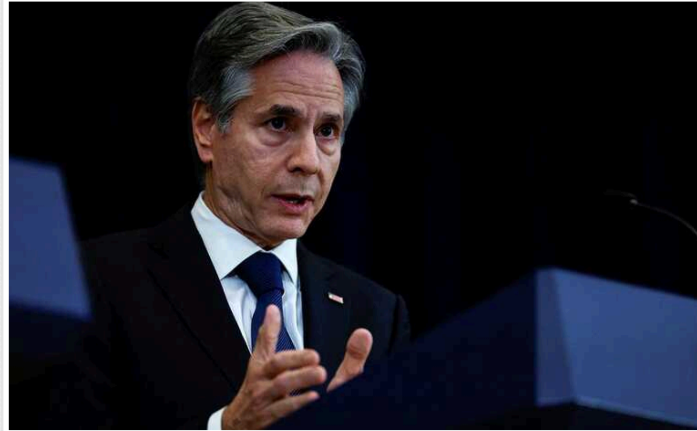
Блінкен вказав на історичну можливість для Ізраїлю: "Практично кожна арабська країна шукає зв'язків"

У найближчі місяці для Ізраїлю є "екстраординарна можливість" нормалізувати відносини зі своїми арабськими сусідами. Цього щиро прагнуть практично всі країни Близького Сходу.