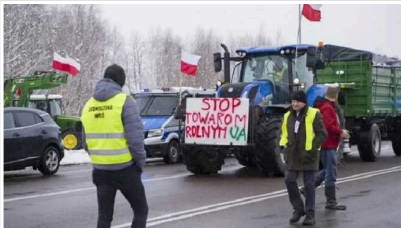
Завтра, 18 лютого, для вантажівок буде заблоковано пункт пропуску "Ягодин-Дорогуськ"

Як повідомляє Держмитслужба, рух буде заблоковано з обох сторін. Для цього до польсько-українського кордону прямують фермери з Німеччини, Бельгії, Нідерландів і Франції, які мають намір взяти участь у масштабній акції протесту.