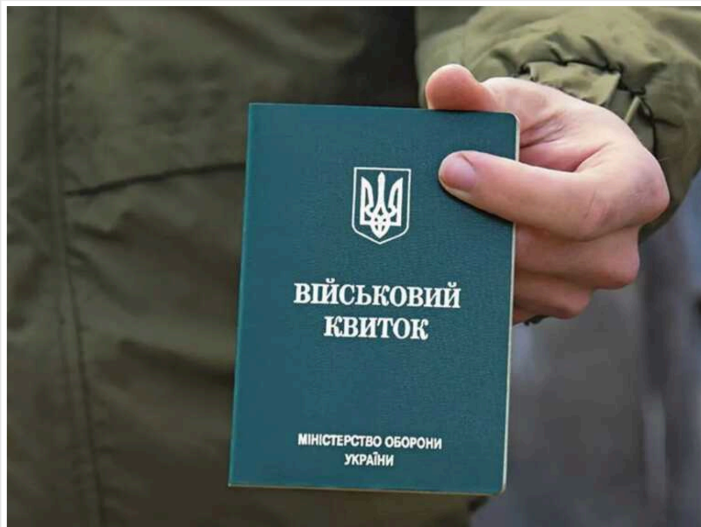
В Ужгороді стався конфлікт із військкомами

В Ужгороді стався черговий скандал із вуличною мобілізацією.