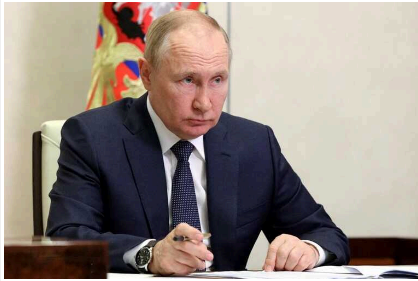
ЗМІ дізналися деталі розробок «протисупутникової зброї» в Росії: концепція виникла ще наприкінці Холодної війни

Держава-терорист Росія намагається розробити ядерну космічну зброю, яка нібито дозволить знищувати супутники. Окупанти сподіваються, що за допомогою такої розробки зможуть створити у відкритому космосі потужну енергетичну хвилю, щоб вивести з ладу величезну кількість комерційних та урядових супутників.