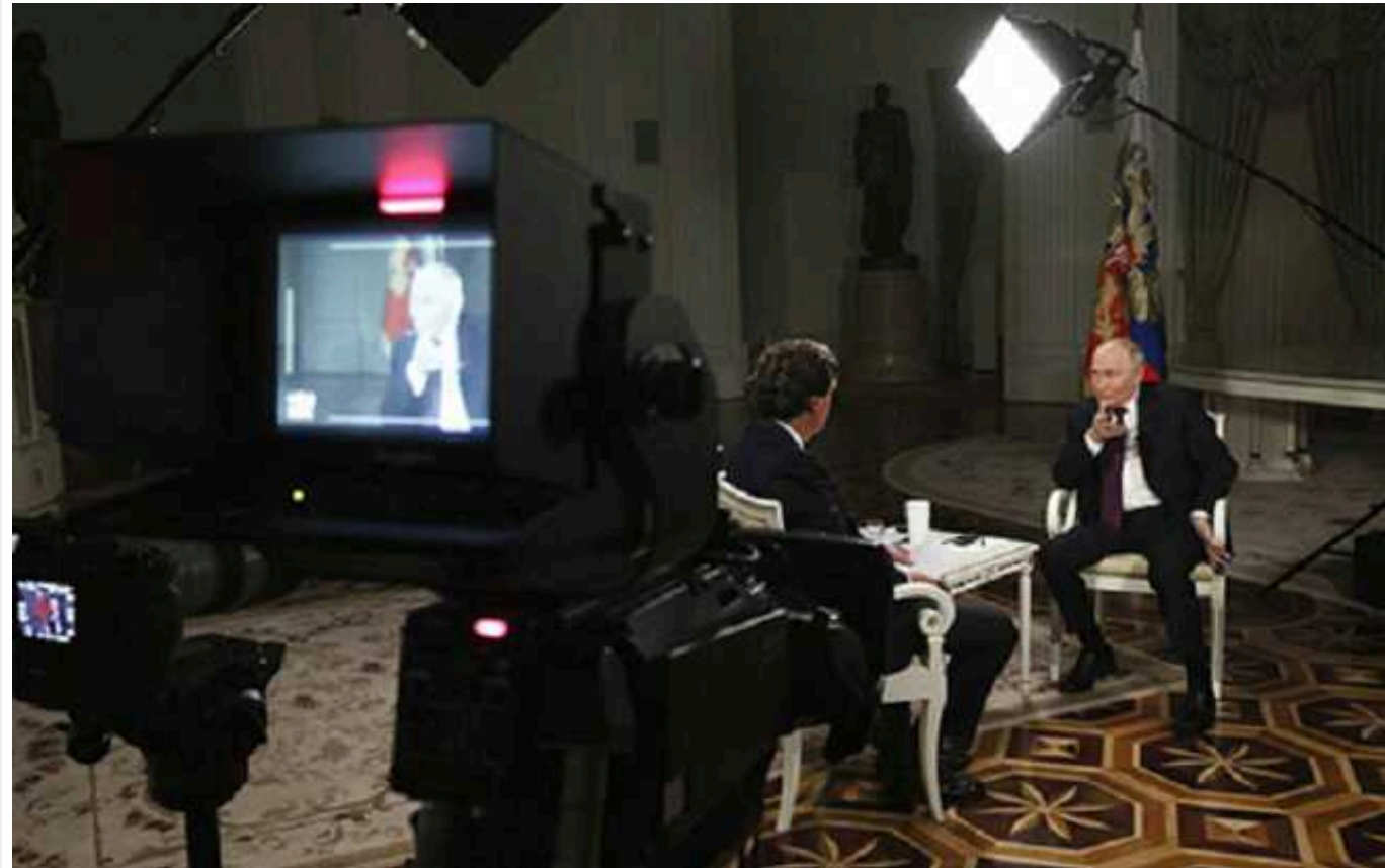
Куніков був спійманий бандерівцями та підданий насильницькій зміні статі: секретна частина інтерв'ю Путіна Такерові Карлсону, – Василь Рибніков

Після оприлюднення історичного інтерв'ю президента Росії Володимира Путіна найвеличчійшому журналісту США Такерові Карлсону багато хто подумав, що злі бояря Байдена підмінили істинне інтерв'ю розумного і дуже вялікого Путіна на яєсь похнюплене хворобливе бурмотіння божевільної бабки, а справжнє приховали. Так воно й вийшло, але, на щастя, у Росії правда не тоне, а шила у валізці не сховаєш.