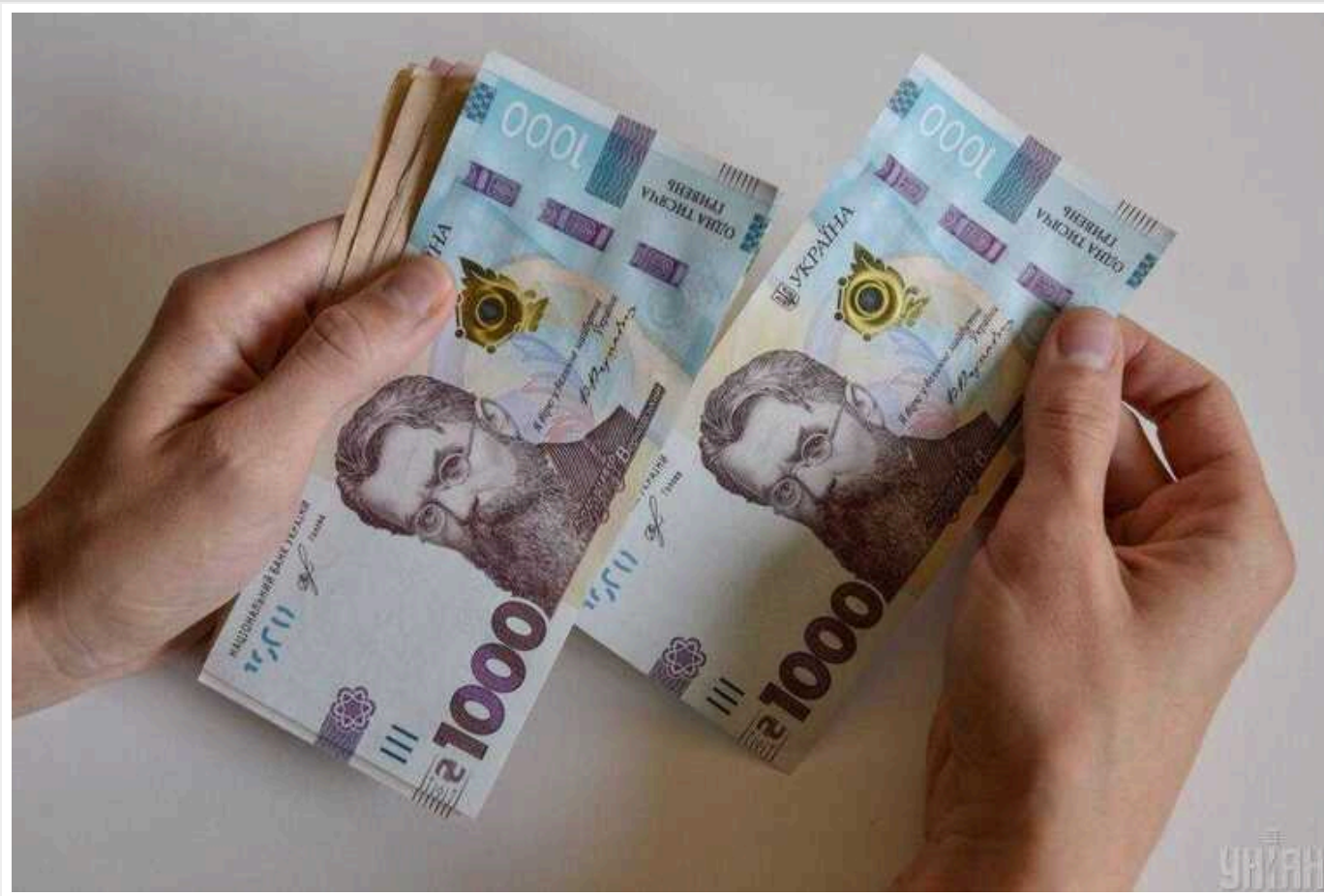
В профільному комітеті ВР готують зміни чинної системи соцвиплат