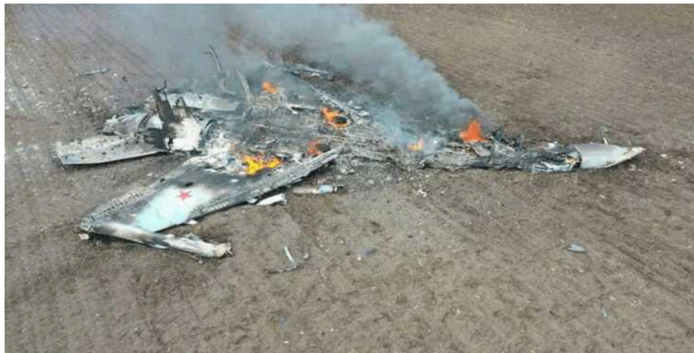
У ЗСУ потролили росіян через 3 збиті літаки і порадили, де шукати «братів»

У Повітряних силах ЗСУ вже встановили, де шукати збитих пілотів РФ, а ось самі росіяни їх не можуть знайти. Командувач Повітряних сил Микола Олещук підказав окупантам спеціальну пошуково-рятувальну систему.