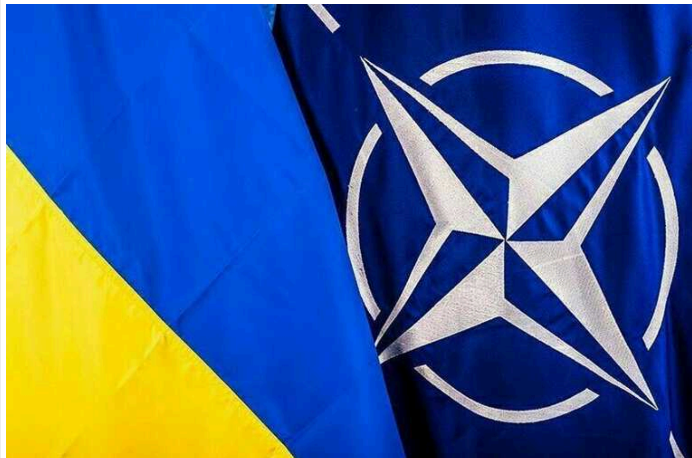
У НАТО відреагували на відступ ЗСУ з Авдіївки: "Відповідальність несуть усі країни"

Журналісти запитали у міністра закордонних справ Естонії Маргуса Тсахкні, чи спровокувало заморожування допомоги від Заходу український відступ. На що глава МЗС наголосив, що відповідальність лежить на "усіх країнах".