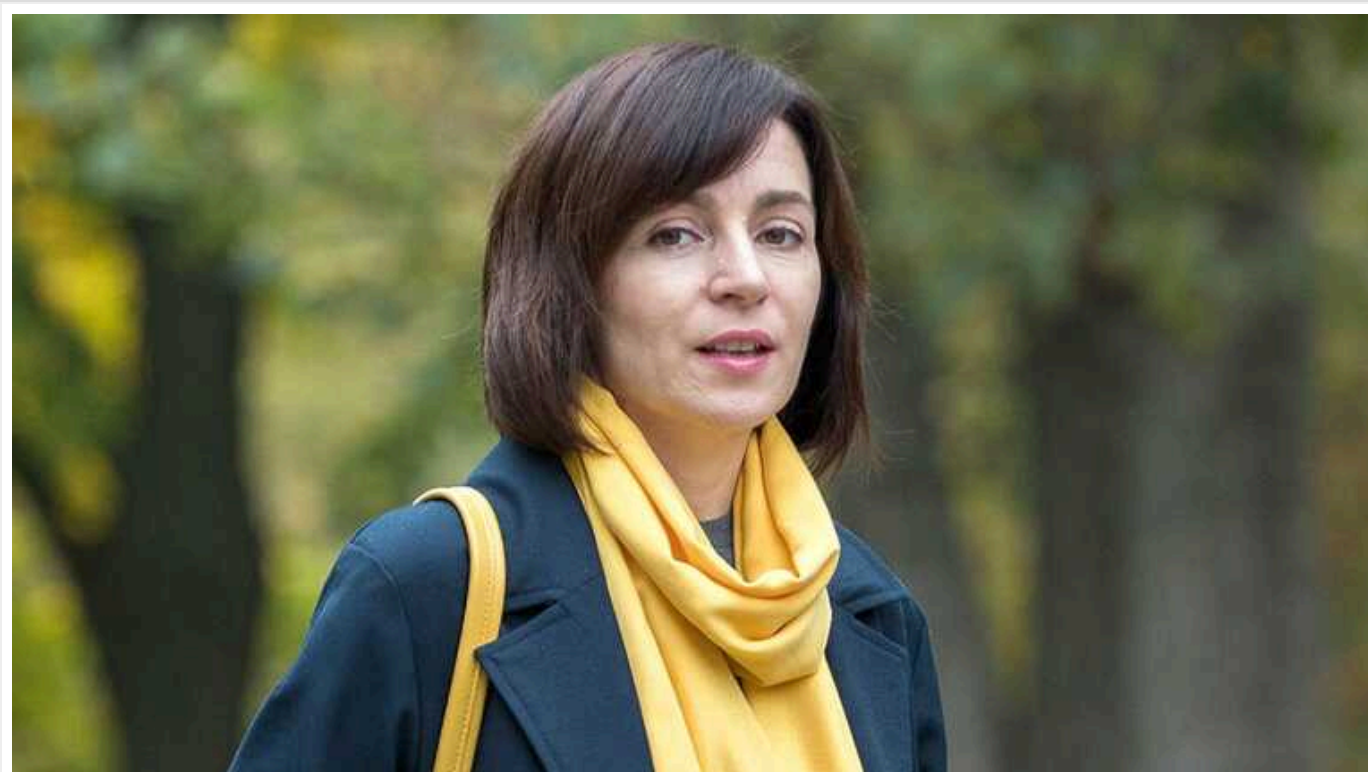
РФ використовує фермерів, щоб розхитати ситуацію в Молдові: виступають проти України, ЄС та блокують кордони

У Молдові набирають оберт протести фермерів: вони вже блокували контрольно-пропускний пункт "Леушени – Албіца" на кордоні з Румунією. Аграрії вимагають від влади дотацій, водночас вони відверто виступають проти пані президента Май Санду. Сама Санду впевнена: ситуацію в країні намагається дестабілізувати Росія, для цього вони використовують проросійського молдовського політика Ілана Шора. Сам Шор втік з Молдови і може перебувати в РФ.