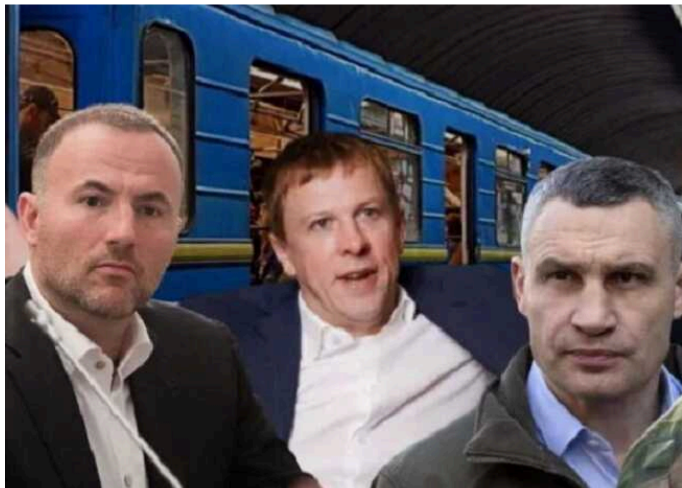
Як команда Кличка знищує інфраструктуру Києва «ефективніше», ніж Росія

У Києві на межі закриття знаходиться ще одна станція синьої гілки метро. В даному випадку йдеться про станцію «Героїв Дніпра», над якою знаходиться ТРЦ «ОАЗИС». Також під загрозою закриття станції «Почайна» та «Тараса Шевченка». Все це завдяки меру столиці та великому господарнику Віталію Кличку.