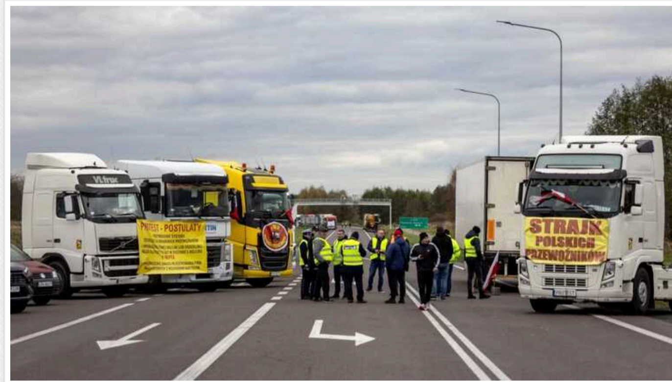
Ситуація на україно-польському кордоні виглядає вже повноцінною катастрофою, виходу з якої ніхто поки не бачить