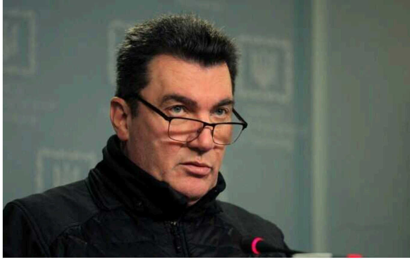
Данілов пояснив, чому РФ отримує зброю швидше за Україну: "Немає жодних процедур"

За словами секретаря РНБО, авторитарні лідери за короткий проміжок часу можуть ухвалювати будь-які рішення.