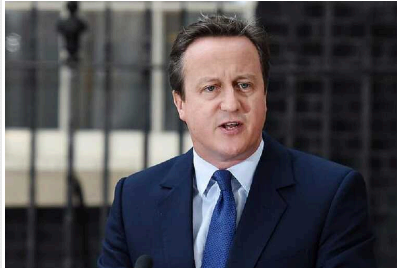
Глава МЗС Британії Камерон: Економіка України та її союзників у 25 разів сильніша, ніж у Росії

Економіка Російської Федерації у 25 разів слабша за економіку України та її союзників. Необхідно зробити цю різницю більш відчутною.