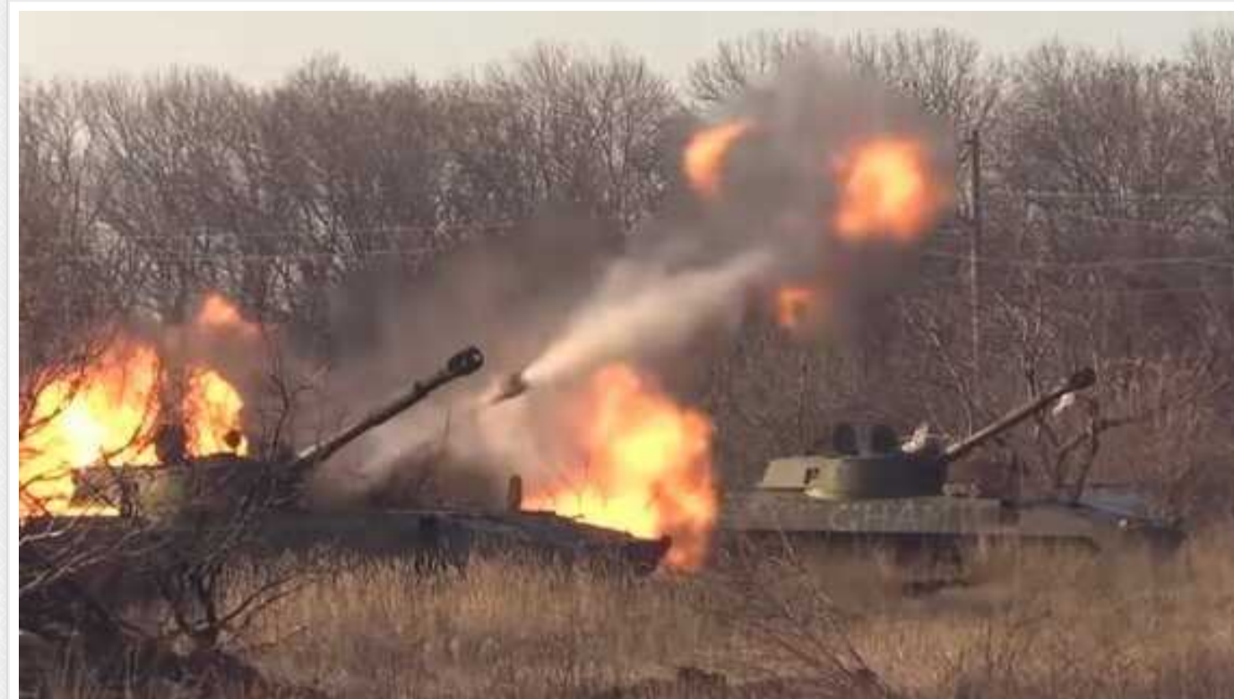
Окупанти здійснили чотири невдалі штурми українських позицій на лівому березі Дніпра

Сили оборони півдня від початку доби знищили 69 російських загарбників, три польові пункти боєпостачання та склад матеріально-технічних засобів.