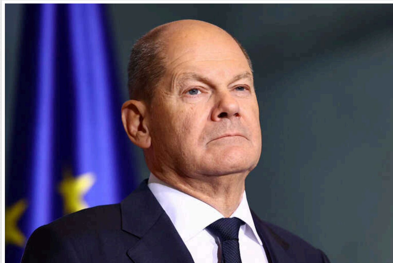
Путін має зрозуміти, що жодного миру на умовах Москви не буде - Шольц

Канцлер ФРН Олаф Шольц заявив, що країни Європейського Союзу повинні продовжувати підтримувати Україну до повної деокупації і виведення російських військ, а також що ЄС не допустить жодного миру на умовах Москви.