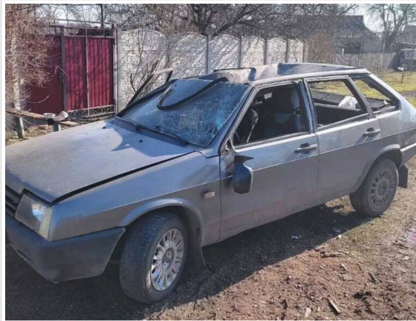
Окупанти на Дніпропетровщині атакували дроном авто: є постраждалі

Від ранку 17 лютого російські загарбники атакують Нікопольський район Дніпропетровської області. У Марганецькій громаді окупанти вдарили дроном по цивільному автомобілю.