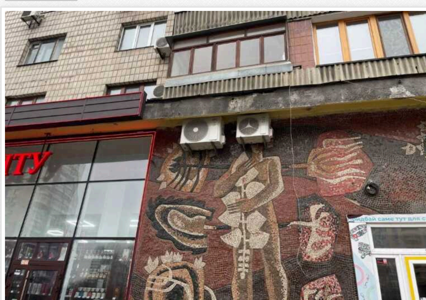
У Києві пошкодили мозаїчне панно відомих українських художників

У Києві на бульварі Лесі Українки на мозаїчному панно 1969 року, відомих українських художників Анатолія Гайдамаки та Лариси Міщенко, встановили кондиціонер. Міська влада вже відреагувала на пошкодження витвору мистецтва.