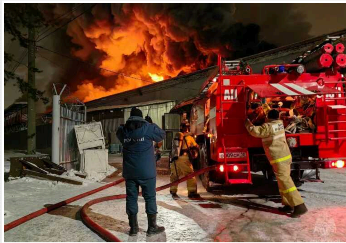
У російському Іжевську горів Торговий центр, який раніше віддали під виробництво БПЛА

У ніч проти 17 лютого у російському Іжевську горів торговий центр, в якому окупанти облаштували виробництво безпілотних літальних апаратів. Водночас у МНС РФ заявили, що пожежа сталася у "виробничій будівлі".