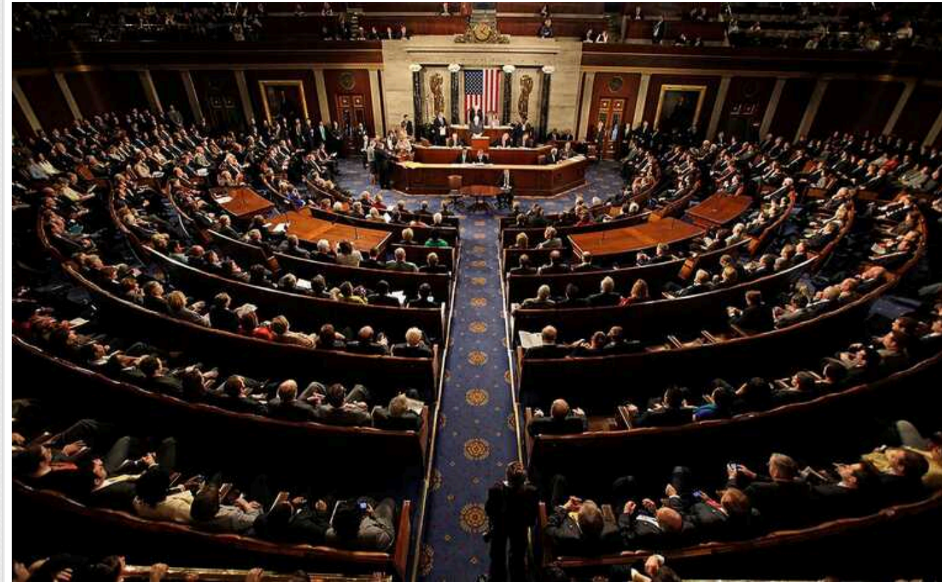
Конгрес США повернеться до питання про допомогу Україні не раніше середини березня

Такий висновок робить агентство Reuters зі слів голови Комітету Палати представників із закордонних справ Майка МакКола.