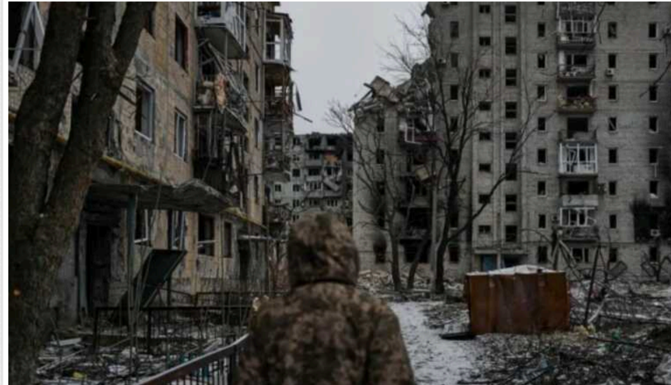
Росія готує фейк про успіх в Авдіївці: хакери проникли у систему моніторингу ЗМІ

За словами членів "Кібер Спротиву", попри просування окупантів на певній ділянці фронту, вони несуть такі втрати від оборонців міста, що у Кремлі змушені вмикати всю "машину військової пропаганди".