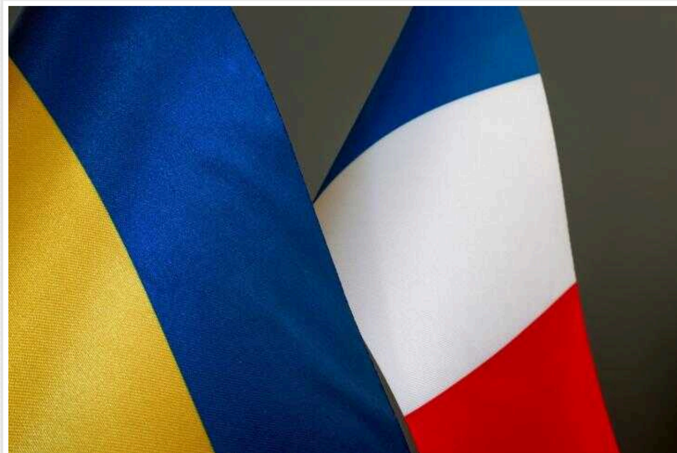
На сайті президента опубліковано угоду про безпеку між Францією та Україною