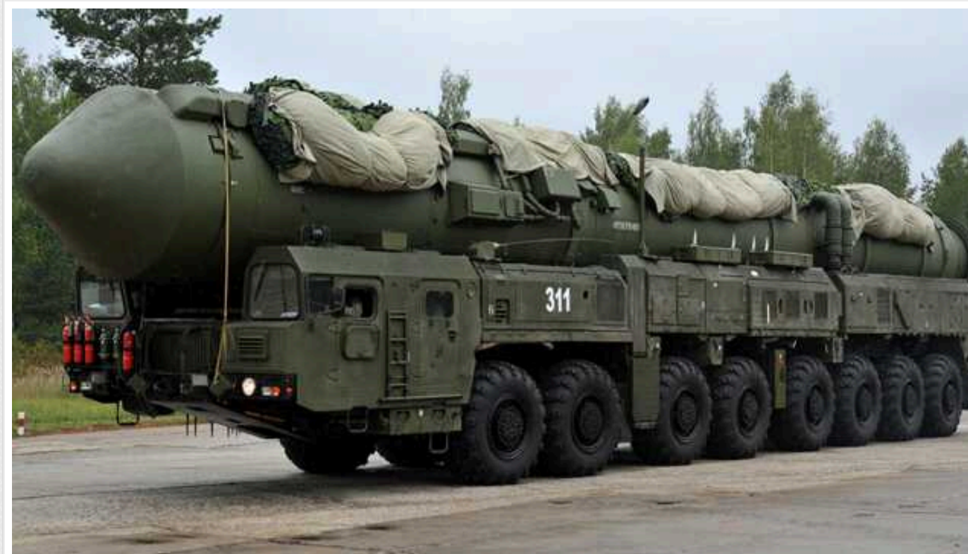
РФ розробляє зброю, яка здатна вивести з ладу "величезну кількість супутників"

Про це пише CNN із посиланням на джерела у розвідці.