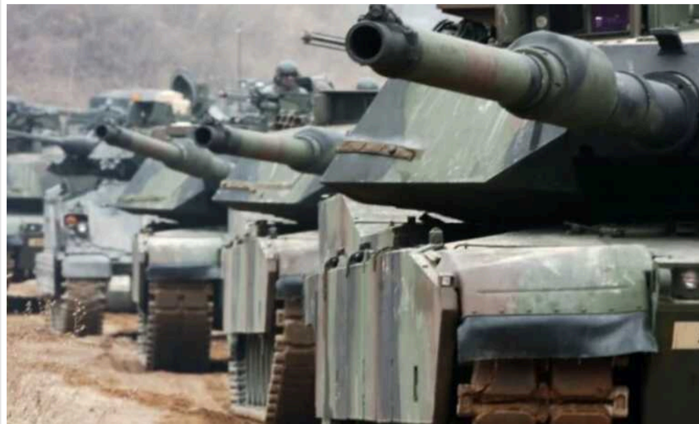
В НАТО б'ють на сполох через агресивну позицію РФ, – Financial Times

За інформацією офіційних осіб, в оперативному командуванні Альянсу розробляють плани щодо того, як їхні військові сили розгортаються навколо Європи, а також підтримуватимуться та посилюватимуться у разі можливого конфлікту із ворогом.